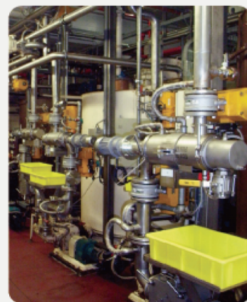
液体ろ過における セルフクリーニング