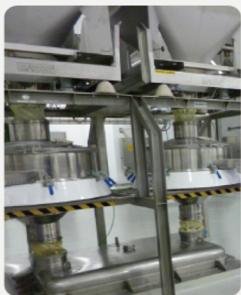
従来の振動篩と比較して 倍以上の生産能力をお約束