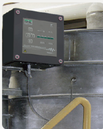
超音波発生装置による 製品の目詰まり防止も可能